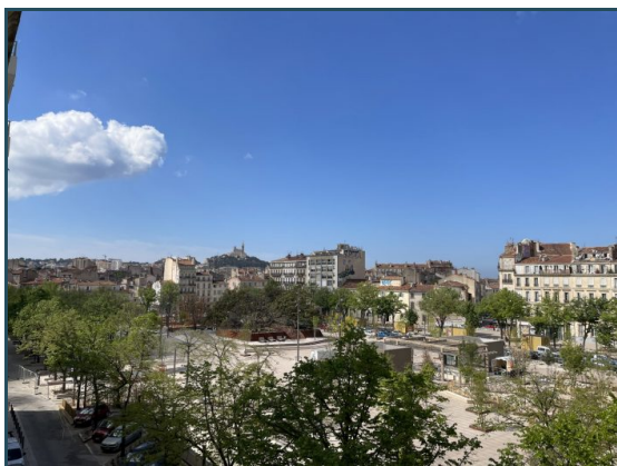
vue place jean Jaurès

Référence VA1924, Mandat N°29 Quartier Notre-Dame-du-Mont